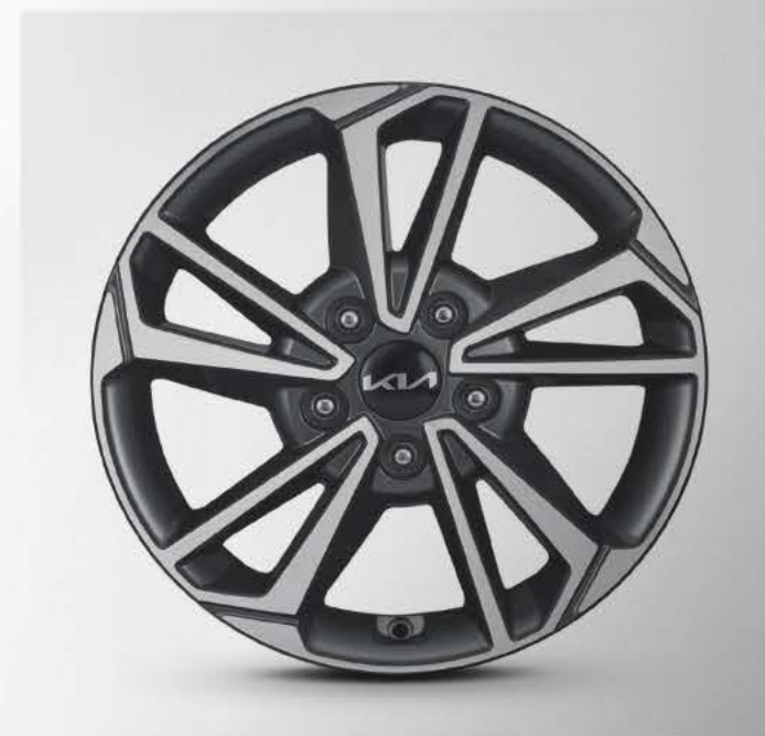
Llantas de aleación aro 16"

Con un aspecto mucho más moderno y aportando más estilo exteriormente es que el Nuevo Kia Cerato viene a encantar a cada estilo de vida. Revitalizando su apariencia para sentirse más potente en cada lugar que visites.